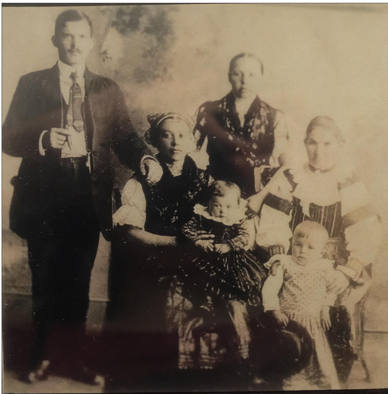
Obr. 10: Rodina z Velčíc; matka v odevnom type 1, dcéry v odevnom type 2; 1910 – 1920.