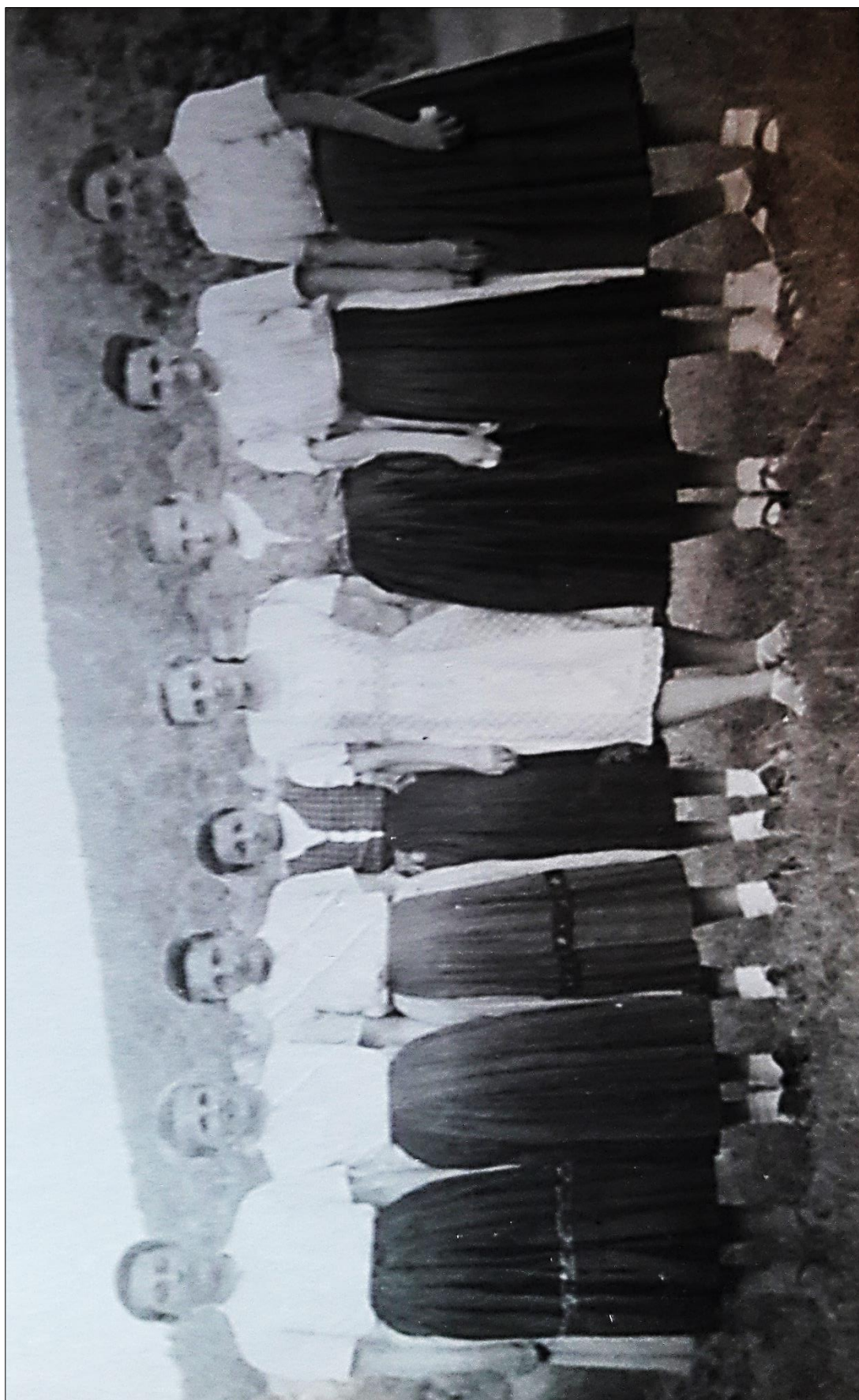
Obr. 9: Dievky z Hostia v odevnom type 2; okolo roku 1950.