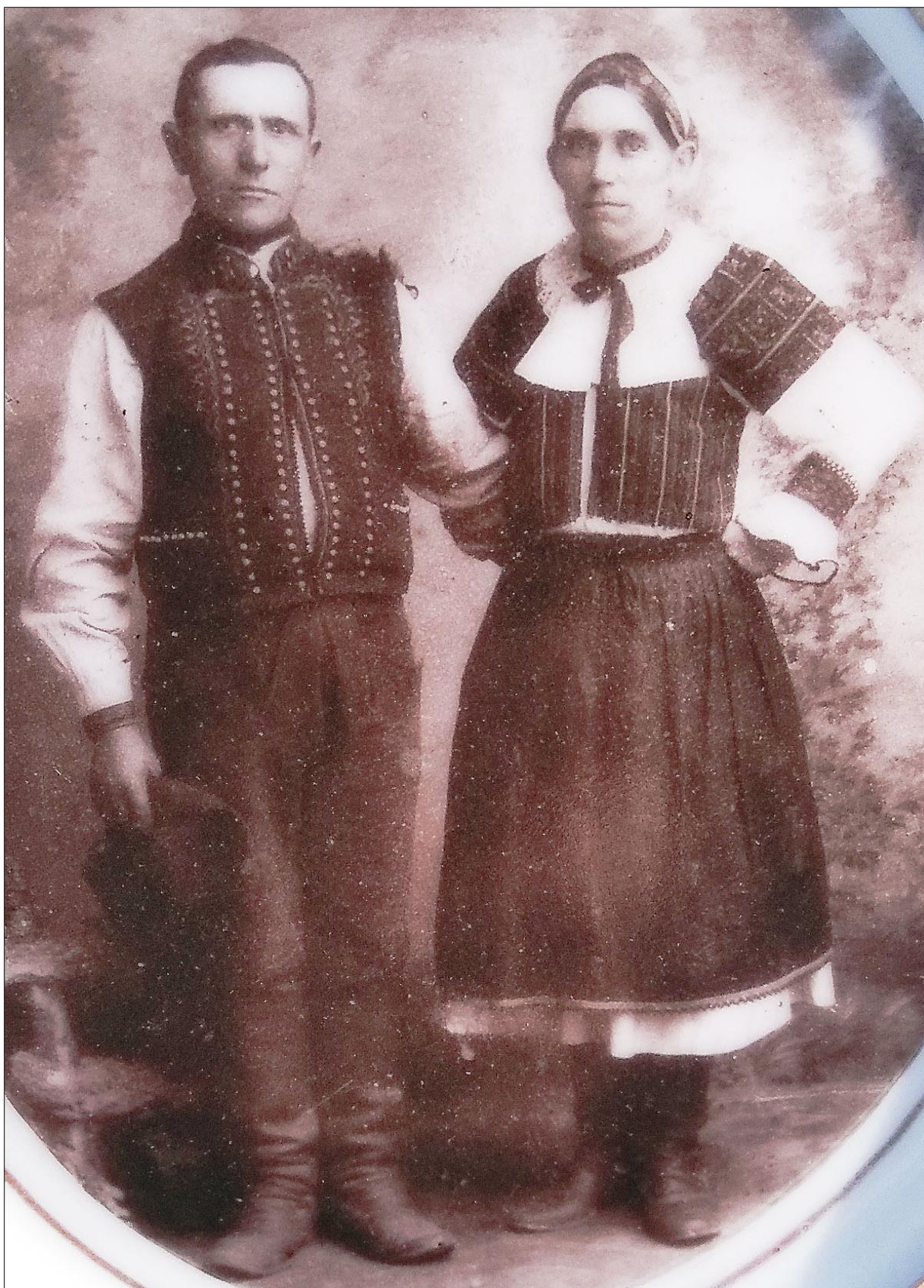
Obr. 2: Obyvatelia Velčíc, žena v odevnom type 1; začiatok 20. storočia (žena narodená 1868). Fotografia na náhrobnom kameni.