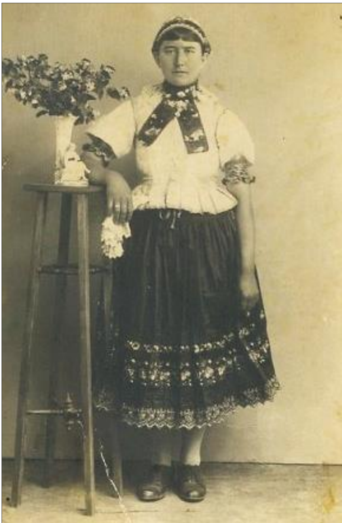
Obr. 14: Žena zo Skýcova v prechodnom odevnom variante; 30. roky 20. storočia. Dostupné na: http://www.skycov.sk/index.php?option=com_phocagallery&view=category&id=54%3Agaleria_ludia&Itemid=122&limitstart=20 .