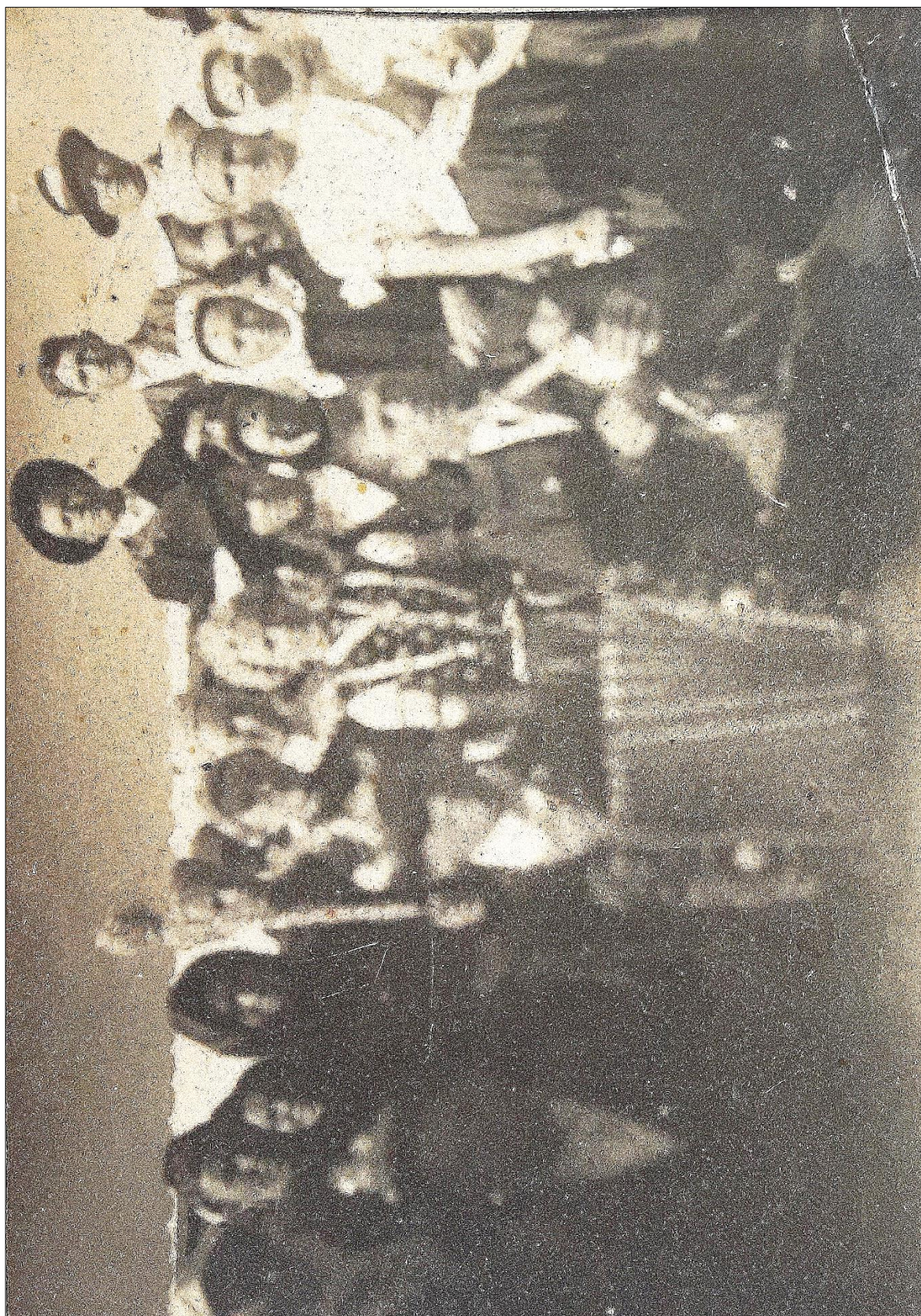
Obr. 12: Svadobčania z Jedľových Kostolian; nevesta v prechodnom odevnom variante; žena naľavo od nevesty v odevnom type 1; ženy na pravej strane fotografie v odevnom type 2; okolo roku 1925.