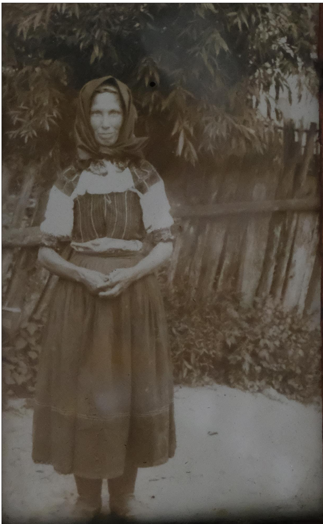
Obr. 4: Žena v odevnom type 1; Jedľové Kostol'any; približne 1950.