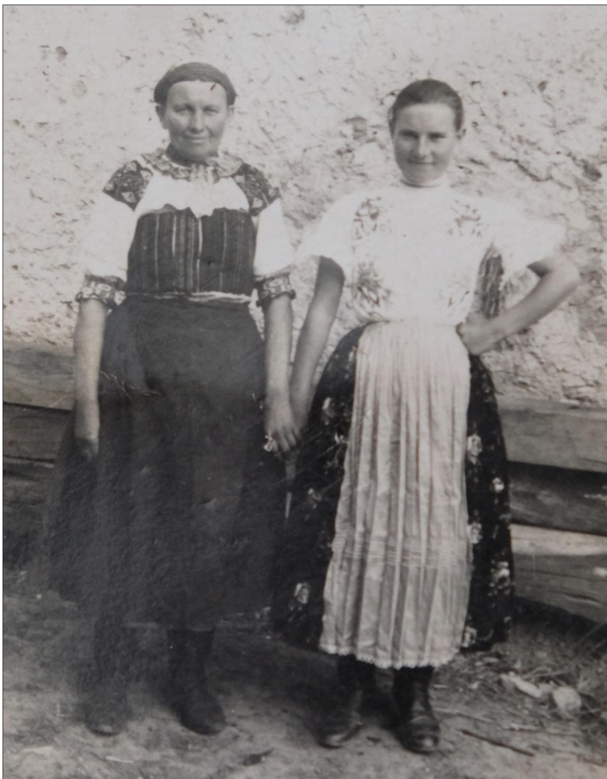
Obr. 13: Ženy z Jedľových Kostolian; matka v odevnom type 1; dcéra v odevnom type 2; koniec 30. rokov 20. storočia. Súkromná zbierka.