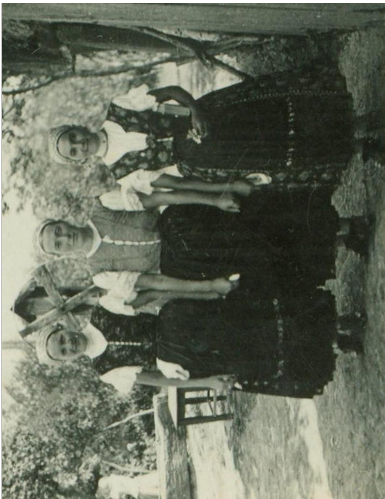
Obr. 8: Ženy zo Sľažian v odevnom type 2; koniec 30. rokov 20. storočia.