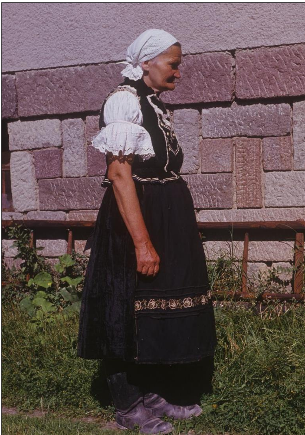
Obr. 15: Žena z Vel'kej Lehoty v mladšom vývojovom štádiu prechodného odevného variantu, bližiacemu sa odevnému typu 2; 1973, rekonštrukcia. Autor: E. Prandová.