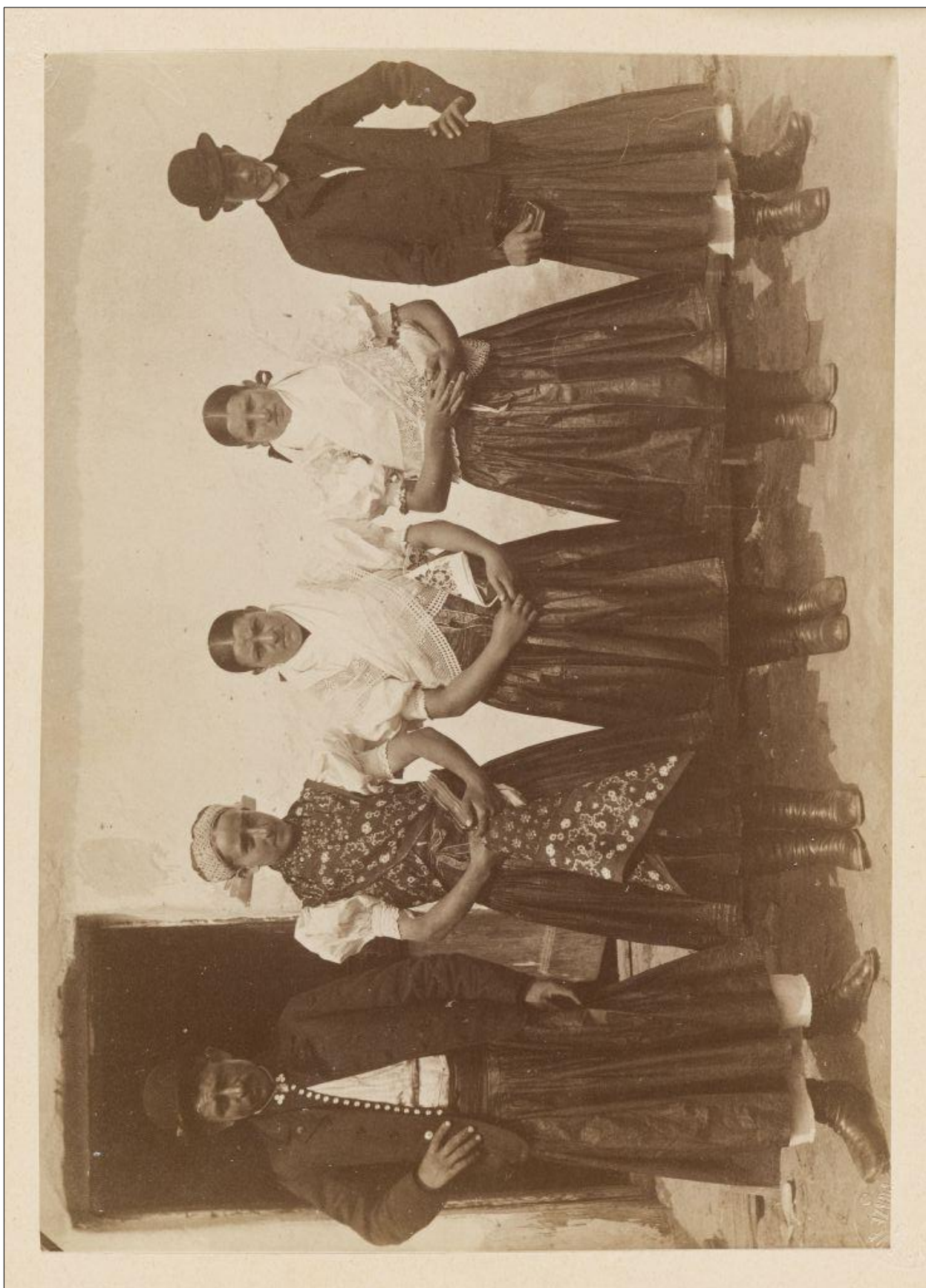
Obr. 5: Ludia v odevnom type 2; 90. roky 19. storočia; nelokalizované. Autor: Jan Koula. Uměleckoprůmyslové museum v Praze, neoznačené.