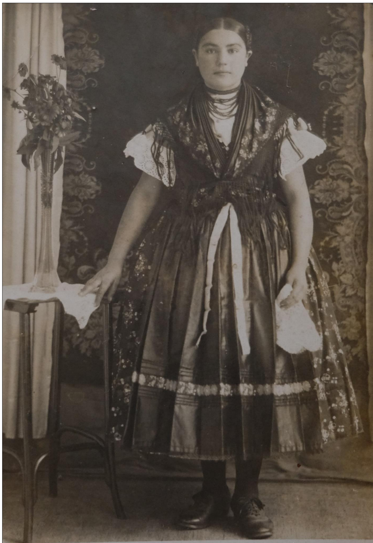
Obr. 7: Dievka z Obýc v odevnom type 2; koniec 20. rokov 20. storočia. Súkromná zbierka.