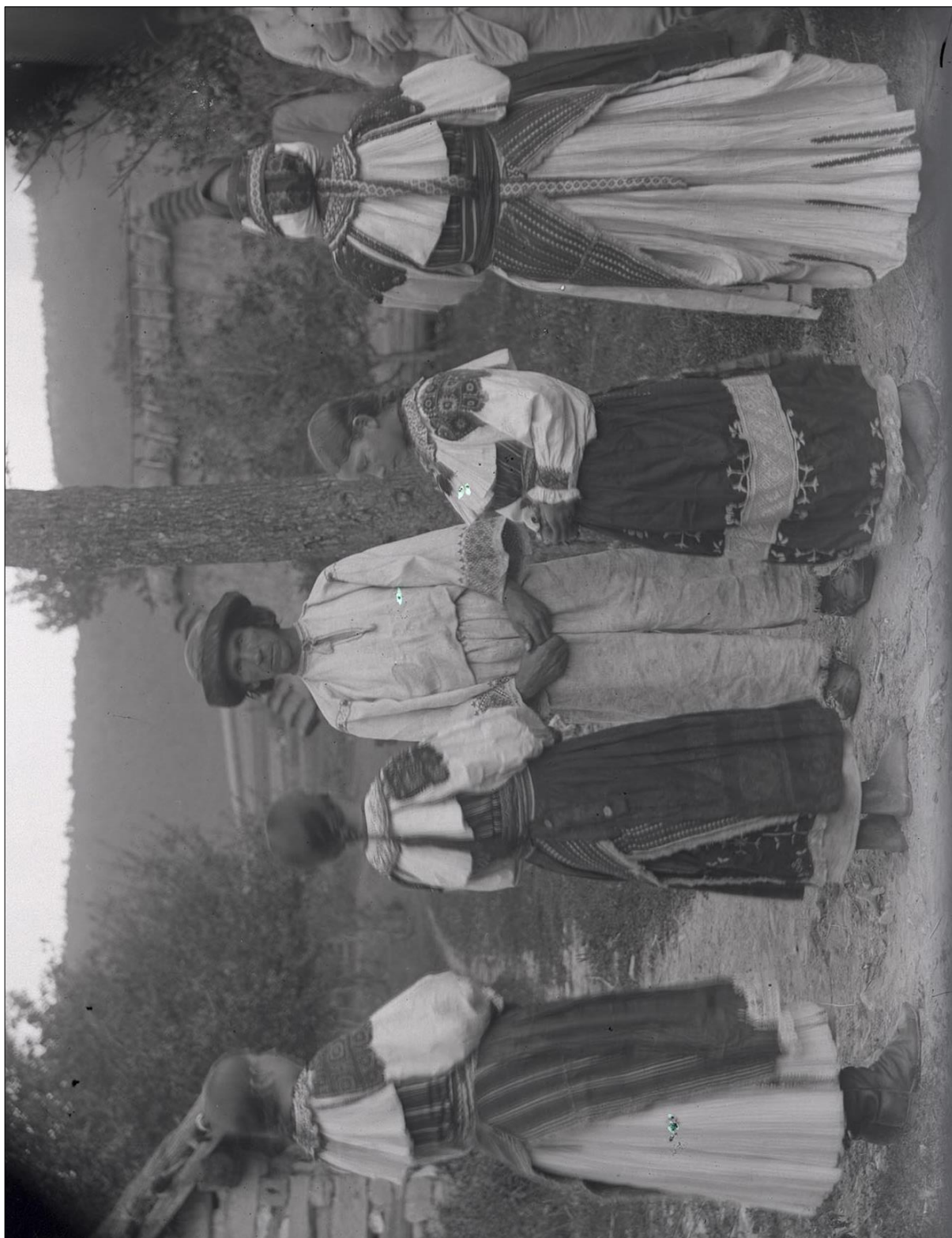
Obr. 1: Obyvatelia Malej Lehoty v odevnom type 1; 90. roky 19. storočia. Autor: Jan Koula. Národní muzeum v Praze, negatív č. 11990.