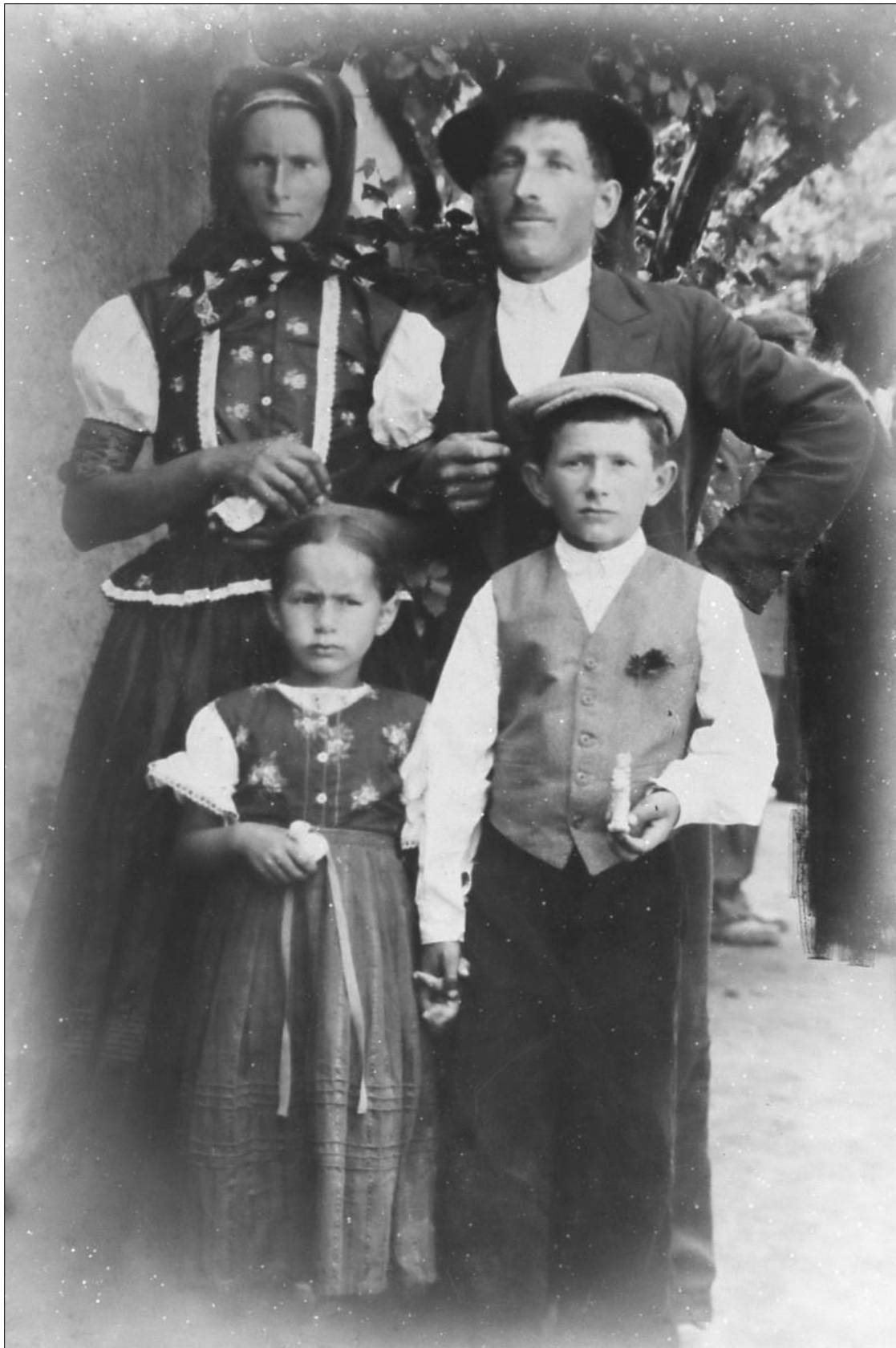
Obr. 11: Rodina z Jedľových Kostolian; žena v prechodnom odevnom variante, dievča v odevnom type 2; 20. roky 20. storočia. Dostupné na: https://jedlovekostolany.sk/historia/kostolianske-kroje-odievania/ .