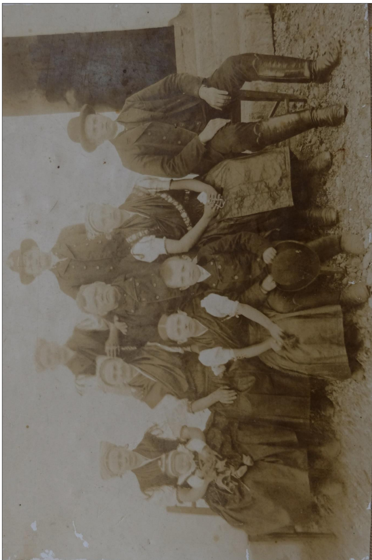
Obr. 6: Obyvatelia Obýc v odevnom type 2; okolo roku 1914.