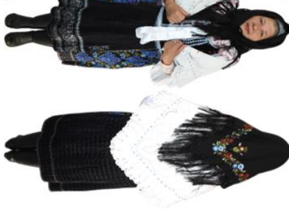
Obr. 21: Dvojstrana Hel'pa (dve strany zo štyroch) V rámci ukážky okolitých etnografických regiónov za Horehronie