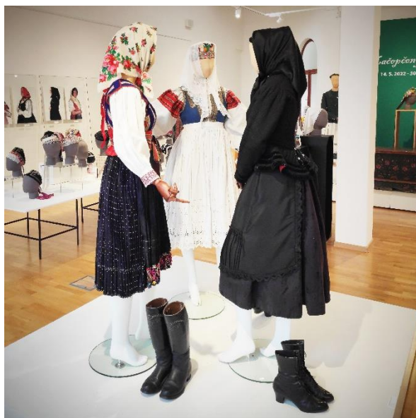
Obr. 12: Tri spišské „grácie,, (Hranovnica, Ostrurňa, Blažov)