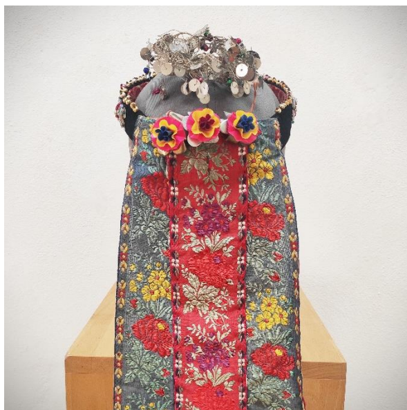
Obr. 16: Parta z Krížovej Vsi (koniec 19. storočia)