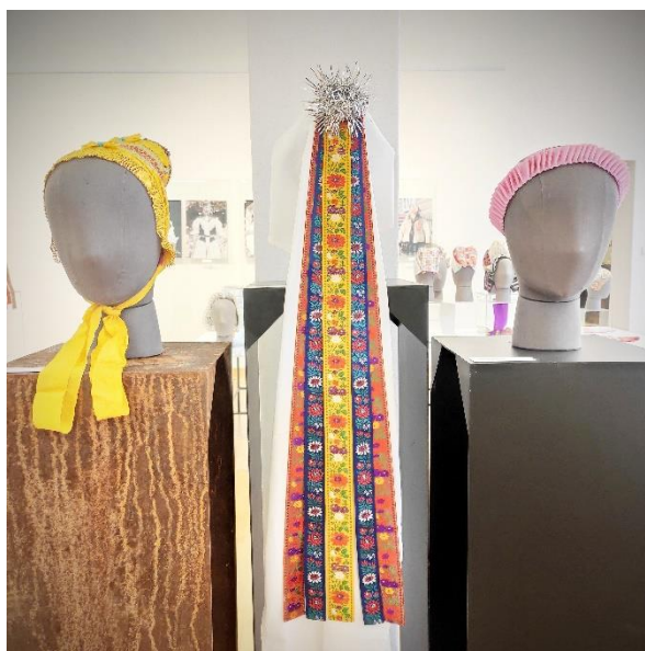
Obr. 14: Premeny odievania hlavy na Šuňave (Nižná Šuňava)