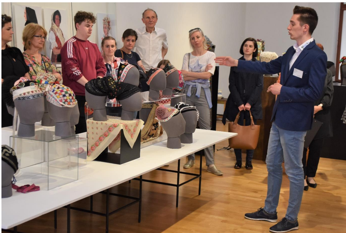
Obr. 6: Otvorenie výstavy – sprevádzanie návštevníčkou po výstave autorom práce