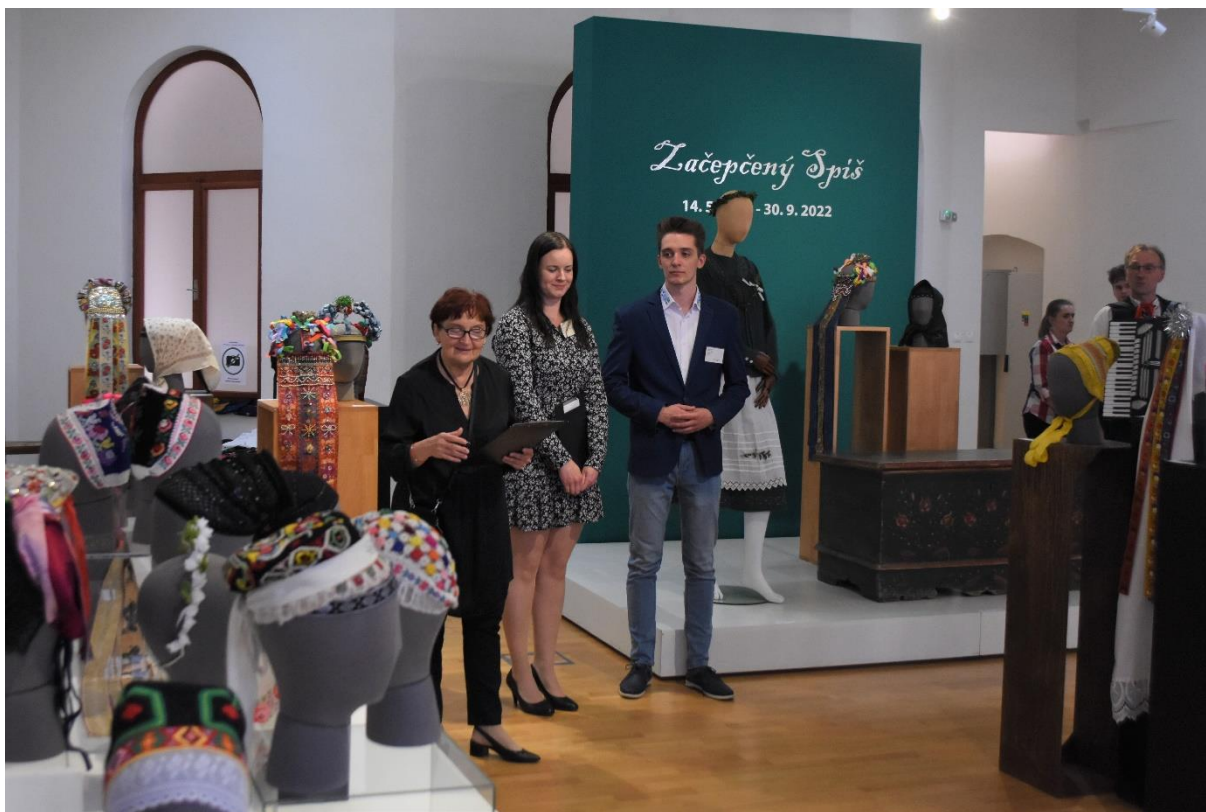
Obr. 4: Otvorenie výstavy Začepčený Spiš riaditeľkou Podtatranského múzea