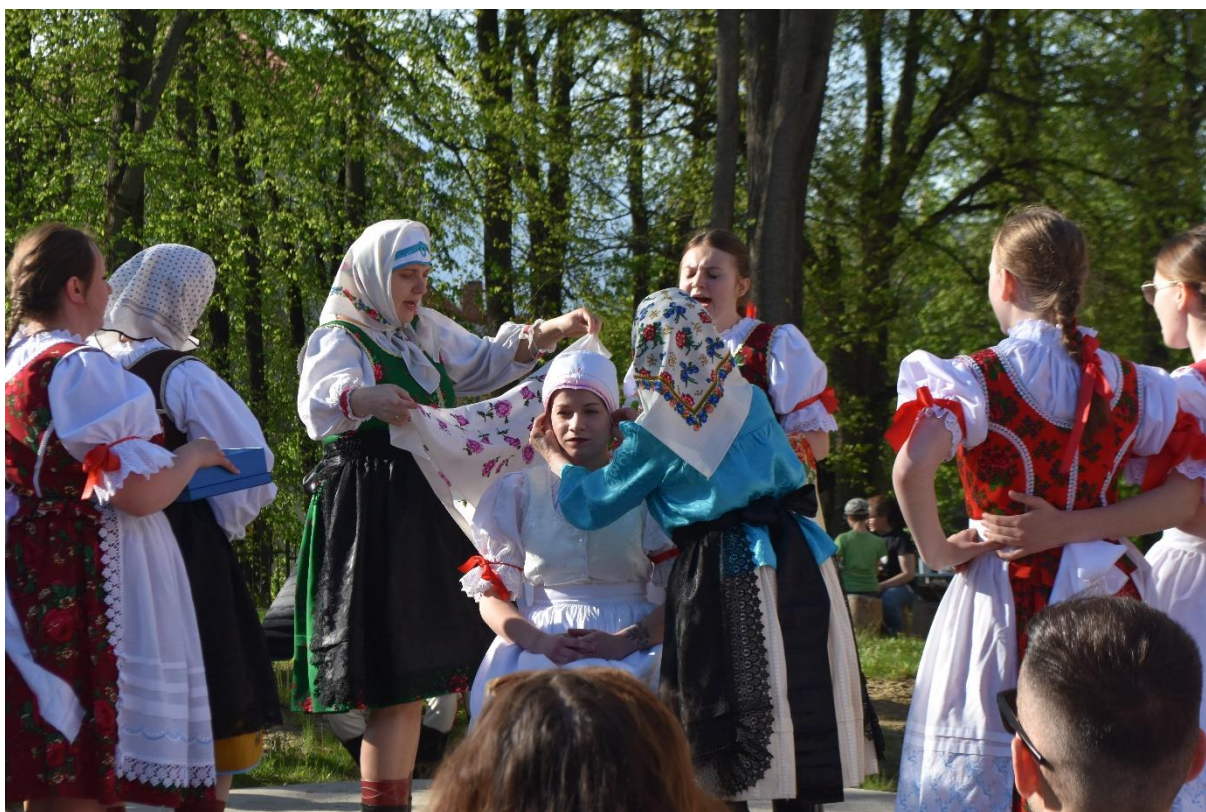
Obr. 7: Otvorenie výstavy – sprievodný program: FS Hajduky z Vyšných Lapšoch a ukážka čepčenia z horného Spiša