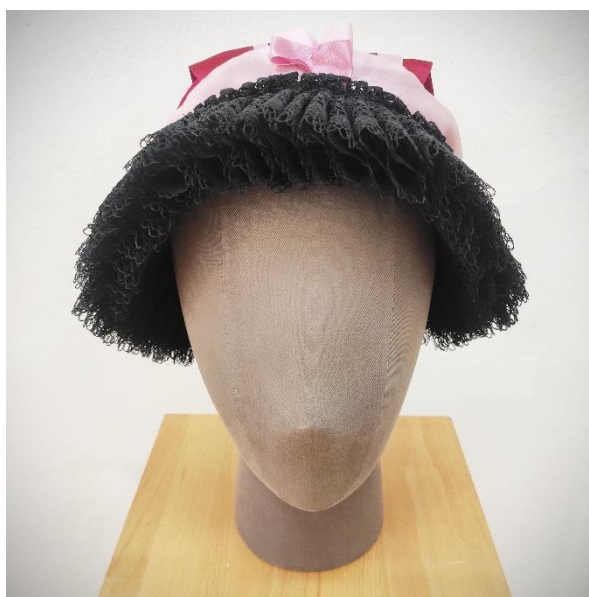
Obr. 18: čepiec /hauba/ z Chmelnice (prvá polovica 20. storočia)