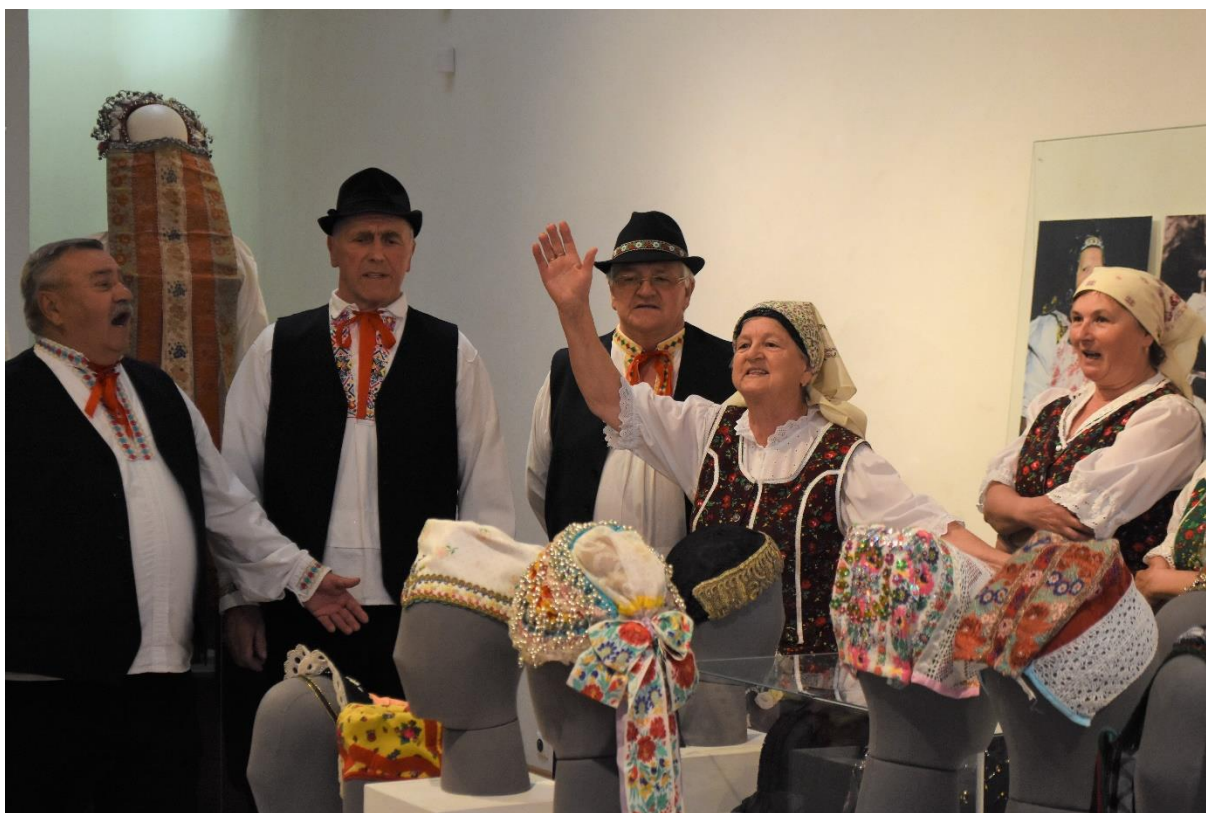
Obr. 5: Otvorenie výstavy – sprievody program – FS Kochman z Hranovnice