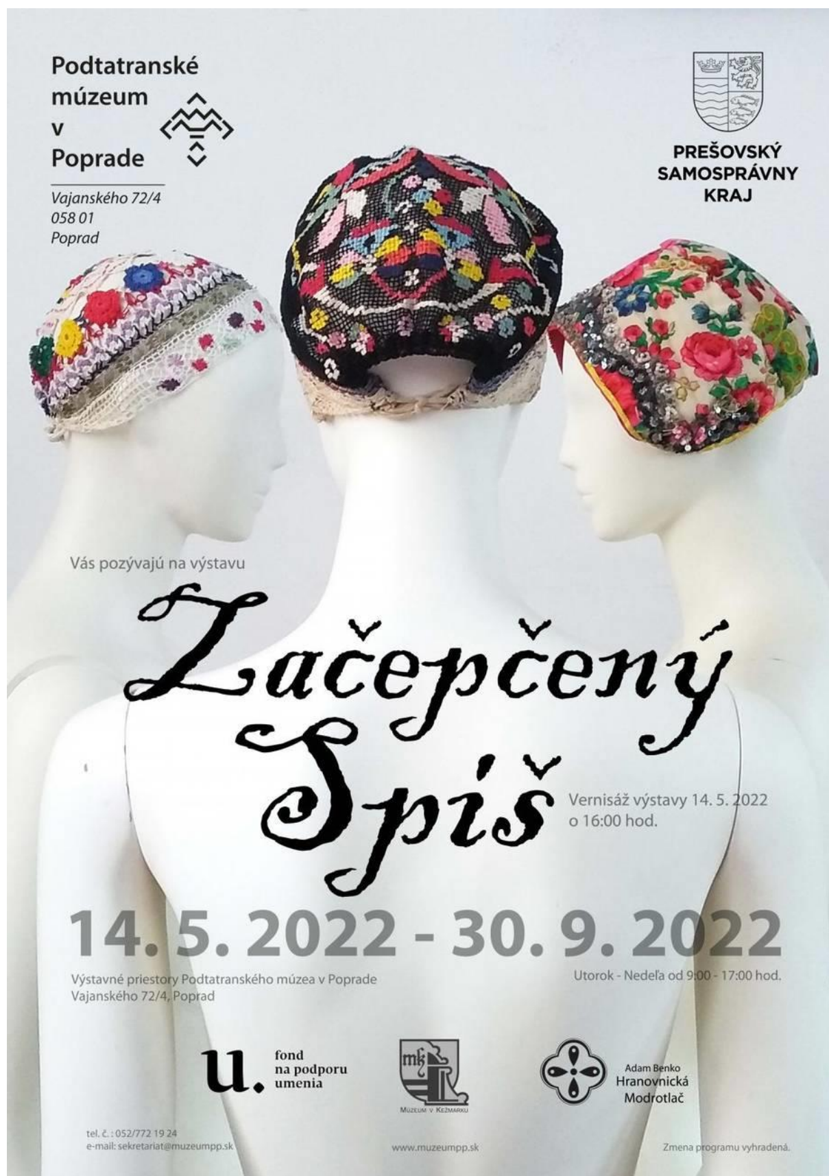
Obr. 1 Plagát k výstave Začepčený Spiš