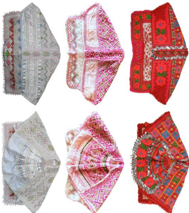
Obr. 22: Dvojstrana Heľpa (štyri strany zo štyroch) V rámci ukážky okolitých etnografických regiónov za Horehronie