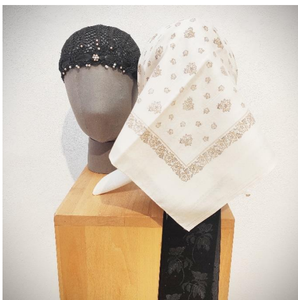
Obr. 17: čepiec z Vikartoviec a Sp. Štvrtku (druhá polovica 20. storočia)