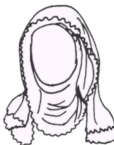
čepiec „ krusele “

Čepiec, ako pokrývka hlavy vydatých žien, je známy u všetkých Slovanov, a to ešte z čias pred príchodom kresťanstva. Slovánske dievča sa podľa niektorých prameňov stalo ženou toho kto jej, prostovlasej, hodil pri stretnutí šatku na hlavu. Nosenie čepca bezprostredne súvisí s obradom čepčenia, ktorý sa konal pred koncom svadby, niekde krátko po nej, a zachovala sa aj tam kde iné tradičné obrady už vymizli, čo len svedčí o dôležitosti obradu v ktorým žena označil zmenu svojho spoločenského statusu. Slovánska žena po vydaji už nesmela chodiť bez pokrývky hlavy. Pokrývky hlavy spočiatku využívali predovšetkým ženy vyšších sociálnych vrstiev, ktoré ich používali ako estetický doplnok, v ľudovom odevu sa začali vyskytovať až trošku neskôr. V polovici 14. storočia sa v strednej Európe sformoval čepiec „ krusele “ ktorí bol na našom území obľúbený aj v 15. storočí. V európskej móde 16. a 17. storočia sa stretávame s veľkou variabilitou v pokrývkach ženskej hlavy na našom území to boli rohaté čepce a sieťka na hlavy „ cepeck “. Od 17. storočia boli už čepce bežnou súčasťou ľudového odevu. Od začiatku 19. storočia v mestskom prostredí začalo nosenie čepca upadať a nosili ho už len príslušníčky staršej generácie najmä doma von uprednostňovali čepcovité klobúky .