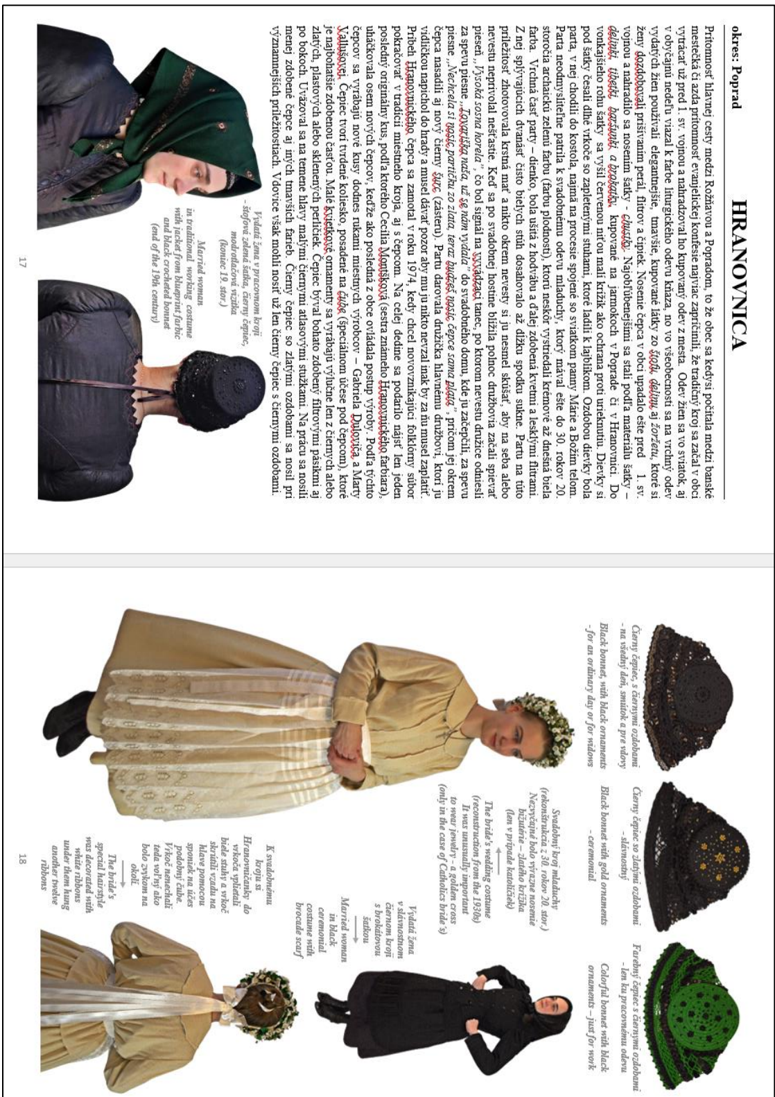
Obr. 19: Dvojstrana Hranovnica