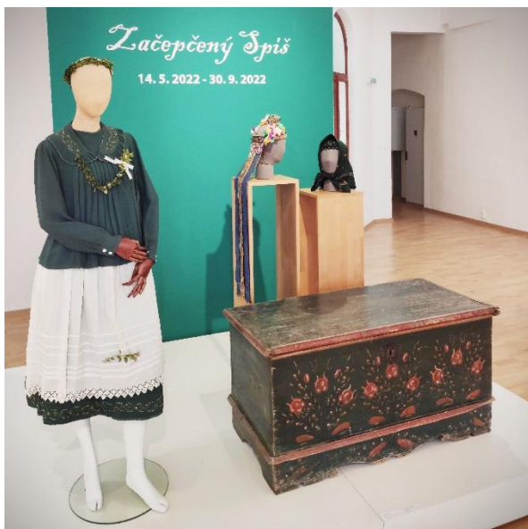
Obr. 11: Hlavná stena výstavy (premeny ženy z Harichoviec)