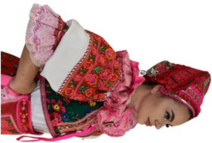
Maláča žena v čepci. Novšia vortla kroja (2. polovica 20. storočia) s „ brošičkou “, matrasní