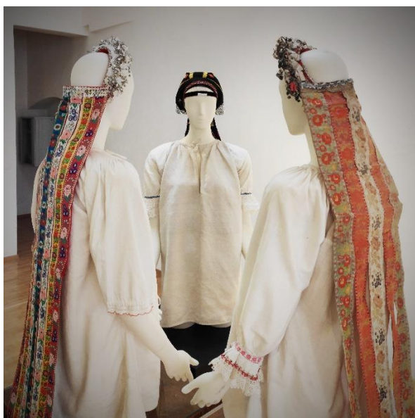
Obr. 13: Hlavná stena výstavy (party z Lendaku, čepiec z Kojšova)