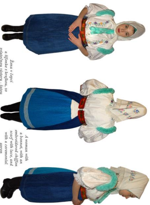
Žena v čepci a šifonku s kňžkou, so svadobnou zásterou - šatou