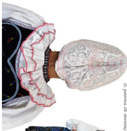
Žena v smútanom oddeve (1. polovica 20. storočia)