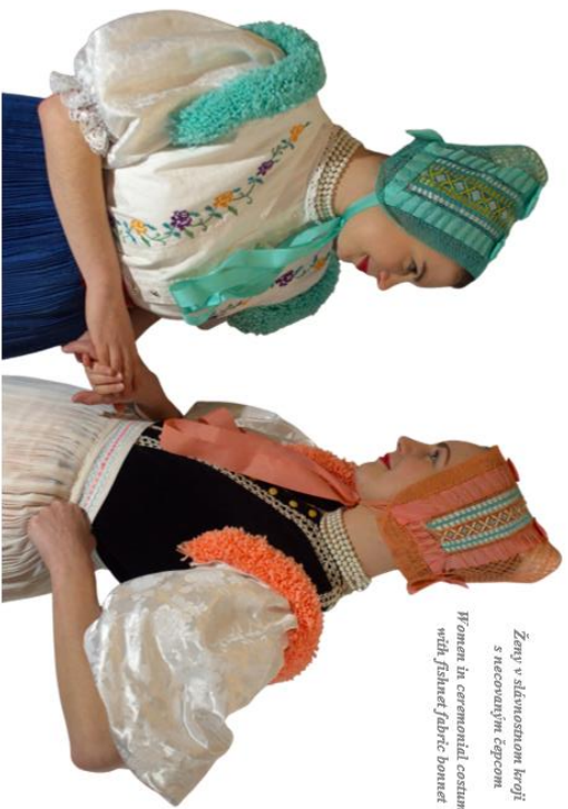
Ženy v šuňavskom kroji s rečovými čepcami with šifonci/farby bonnet